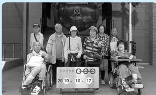
▲ 団体活動時の様子～大宮鉄道博物館