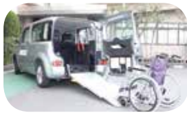
キューブ1500cc 乗車定員4名(車いす乗車含む)