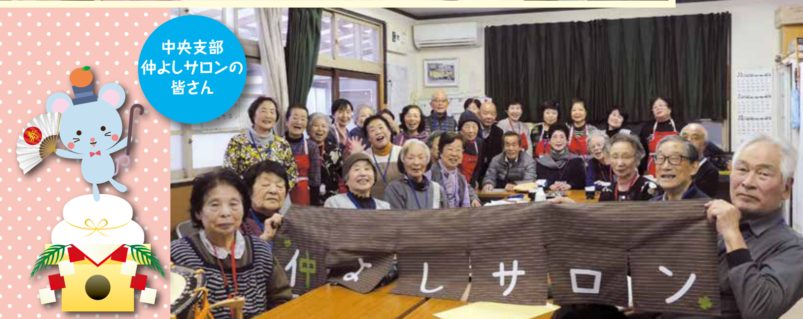
中央支部 仲よしサロンの 皆さん