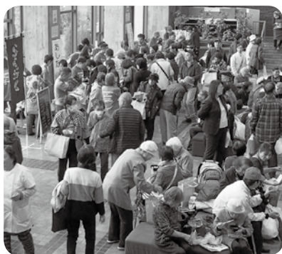
▲多くの人でにぎわうふれあい広場