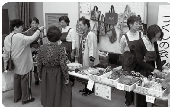
▲毎年、人気の手作り品販売