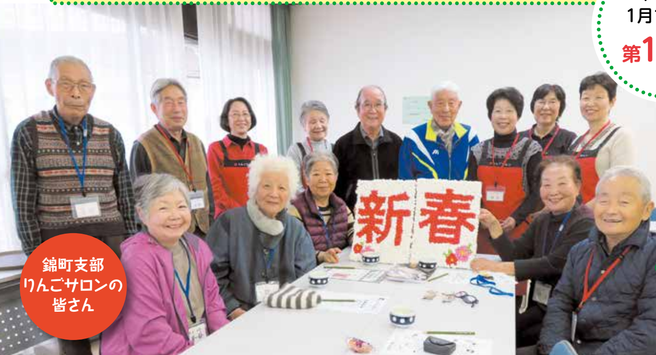
錦町支部 りんごサロンの 皆さん