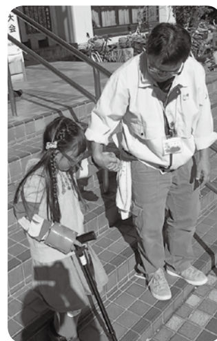
▲高齢者疑似体験、実施中