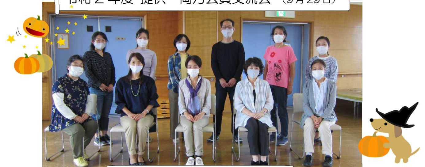
地域の頼れる提供・両方会員さん

社会福祉法人 蕨市社会福祉協議会 わらびファミリー・サポート・センター 〒335-0005 埼玉県蕨市錦町 3-3-27 (蕨市総合社会福祉センター2階) 開所時間 午前8時30分~午後5時15分 (月~金曜日 祝日、年末年始を除く) TEL・FAX 048-443-1800 E-mail w-famisapo@warabi.ne.jp