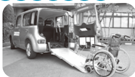
キューブ1500cc 乗車定員4名(車いす乗車含む)