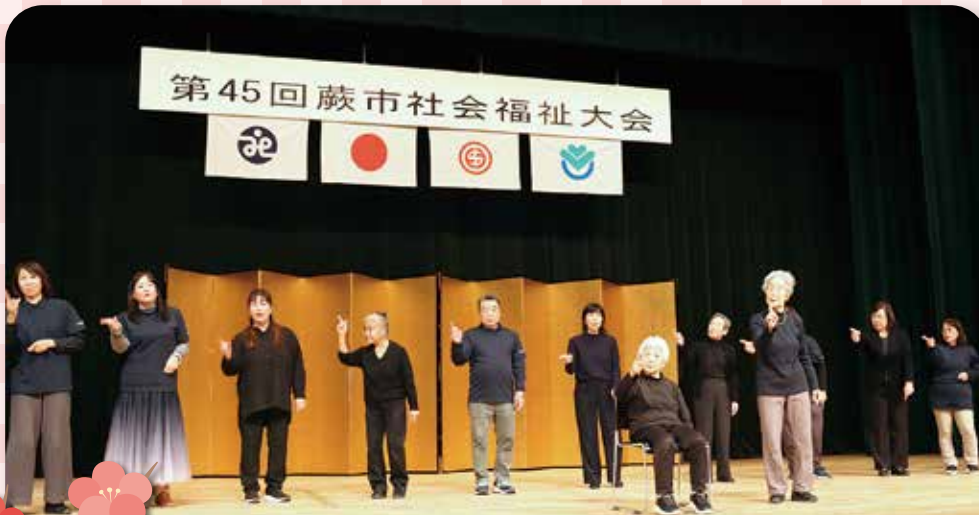
▲ 蕨市聴覚障害者協会と 蕨手話サークルのみなさん