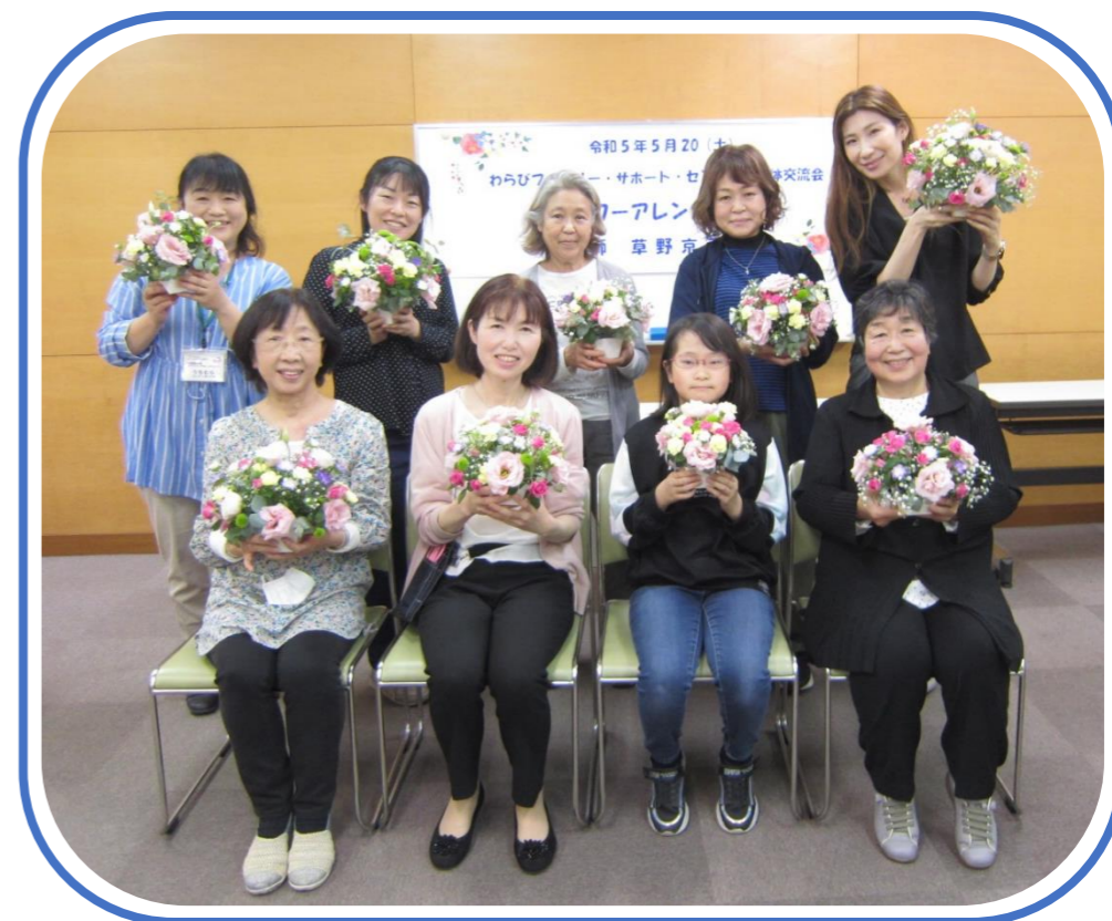
(R5年5月20日全体交流会にて)

夏休みももうすぐです。少しずつ夏の行事開催も増え、ご家族でお休み中にしたいこと、行ってみたいところが沢山お有りかと思ひます。必要に応じて感染症対策を取りながら楽しみましよう。熱中症予防のためにも十分な水分補給や涼しいところでの一休みも大切です。どうぞ楽しい夏休みとなりますように！