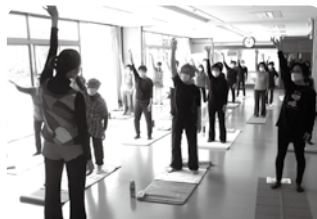
やさしいヨガとストレッチ